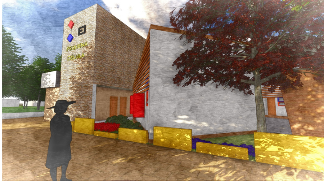
Imagem 81: Sala de repouso (maternal).