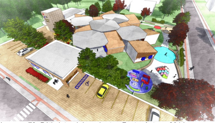
Imagem 79: Pátio lateral descoberto. -Fonte: Autora, 2014.

8 O complexo escolar é organizado ao longo do pátio coberto, este localiza-se no centro da instituição de ensino formando um eixo importante de conexão para a área externa (pátio descoberto). O pátio apresenta uma espécie de escada-arquibancada, que convida as crianças a sentar-se e também é um local que pode ser usado para apresentações servindo como palco para as crianças, como também para exposições dos trabalhos das mesmas, sendo uma área tanto para atividades coletivas como para as individuais.