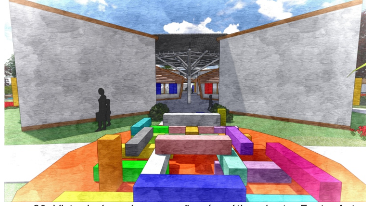
Imagem 80: Vista da área de recreação p/ o pátio coberto.

9 Em ambos os lados do pátio coberto, encontram-se mais dois pátios: o pátio lar 01, que abriga o ensino maternal, com crianças de 0 a 3 anos de idade e o pátio lar 02 que abriga a pré-escola, com crianças de 3 a 5 anos, esses pátios funcionam como uma espécie de "hall de entrada" para as salas, servindo também como a própria extensão da sala de aula, esses pátios também funcionam como distribuição e não para brincadeiras, estas acontecem no pátio central e no pátio lateral descoberto, nelas as crianças podem brincar de várias maneiras, tais como: brincadeiras de roda, bambolês, pintura coletiva etc, já que é um espaço coberto e amplo, o que ajuda na interação das mesmas. O pátio lar 01 dá acesso principal ao setor de serviço como: refeitório, cozinha, depósitos e sanitários e o pátio lar 02 dá acesso ao pátio lateral descoberto para espaços atividades.