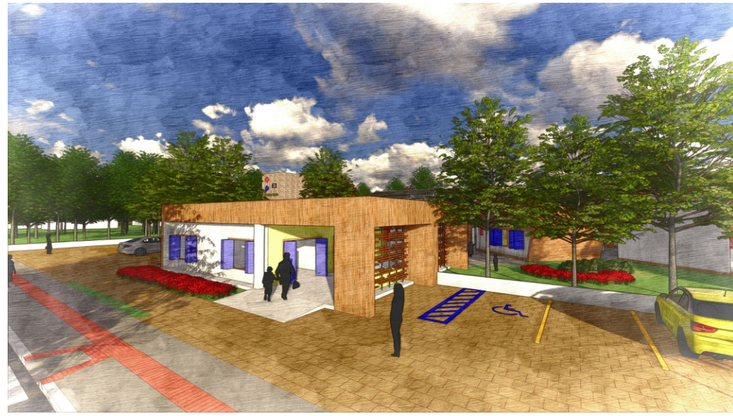
Imagem 76: Entrada principal (ADM).

7 As volumetrias das atividades de apoio (administração e serviço) foram propostas com uma linguagem diferente, para não confundir a identificação da criança com o módulo de ensino.