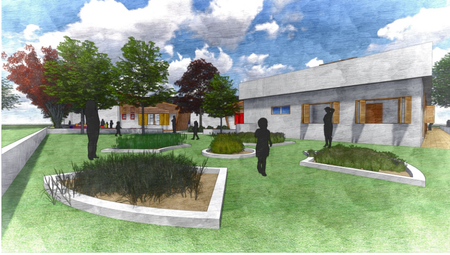
Imagem 77: Fundos bloco de serviço.

7 As volumetrias das atividades de apoio (administração e serviço) foram propostas com uma linguagem diferente, para não confundir a identificação da criança com o módulo de ensino.